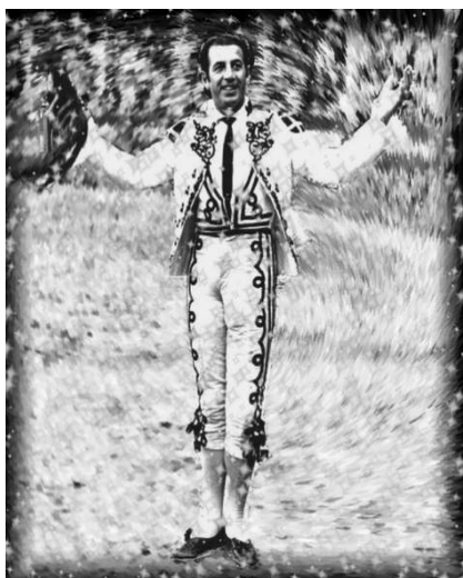
Agradecimiento al respetable