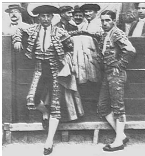
Protagonismo en la Plaza

patrimonio cultural inmaterial. De no ser así, el reconocimiento a nivel de la UNESCO queda imposible. Para ello es necesaria una voluntad conjunta, en cada uno de los ocho países taurinos, por parte de las comunidades de aficionados y profesionales, por parte de los investigadores y expertos en el tema, y por parte de los políticos a los que tocará dar cabida a esta empresa ante las instituciones oficiales y competentes. El expediente que se elabore deberá en particular responder a estas preguntas principales: ¿qué significado cultural tiene este espectáculo con la muerte de un toro en un acto público, profundizando lo que he sugerido más arriba? Qué valores éticos y estéticos encierra nuestra Fiesta? ¿De qué modo es un factor de identificación y de autovaloración para las comunidades aficionadas, respetando la diversidad de sus sensibilidades?